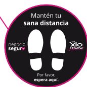
Señalética en el piso