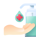
Alcohol en gel al 70%