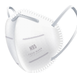
Uso obligatorio de cubrebocas