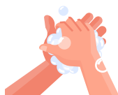
Lavado de manos constante